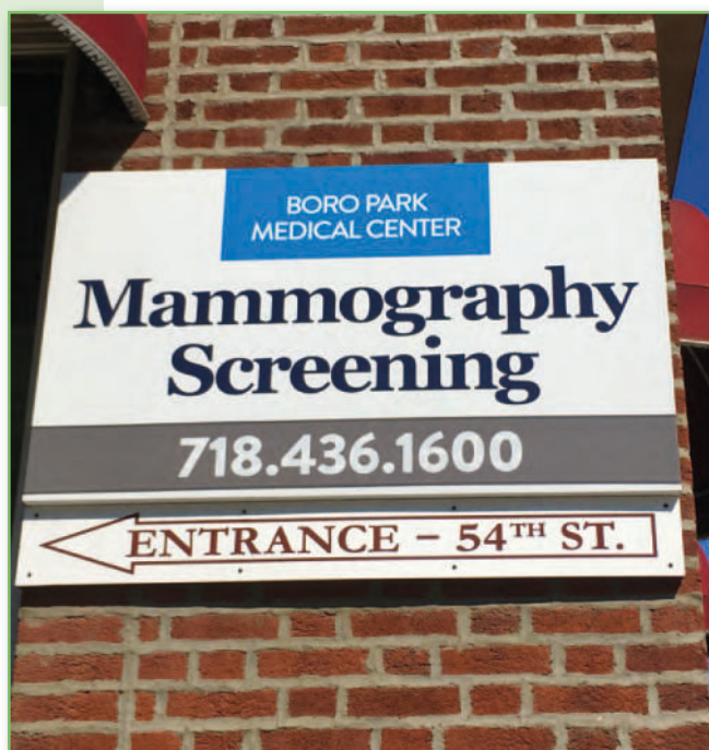
Hinweisschild zum Screening in New York