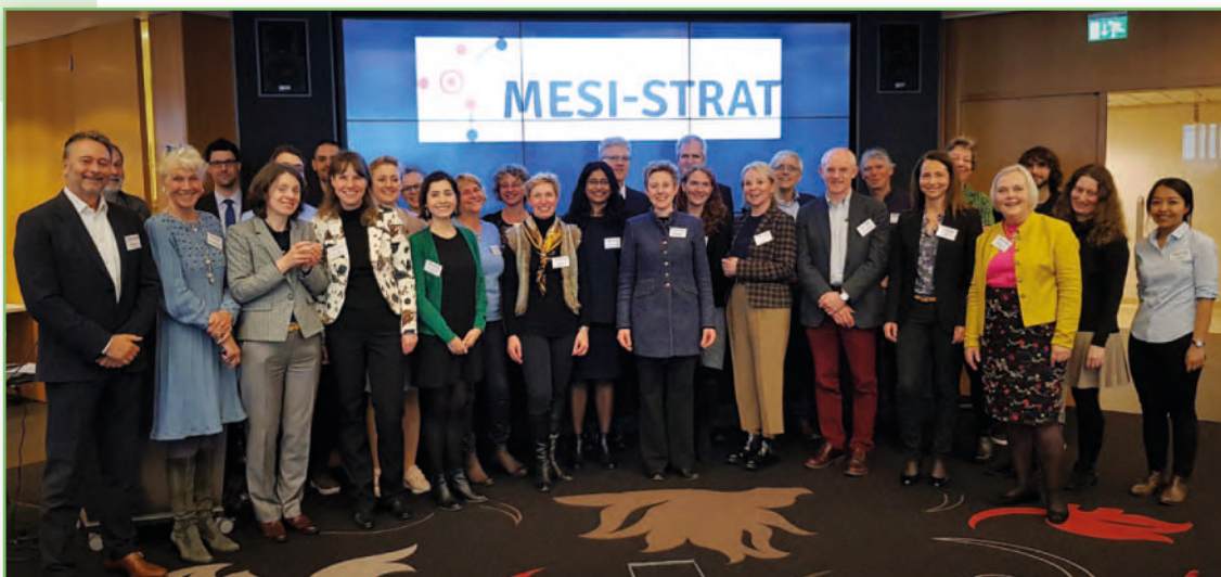
Das MESI-STRAT-Team in Groningen beim Kick-off-Meeting

Dieses Projekt wurde und wird im Rahmen des Forschungs- und Innovationsprogramms Horizon2020 der Europäischen Union finanziert unter der Fördervereinbarung mit der Nr. 754688